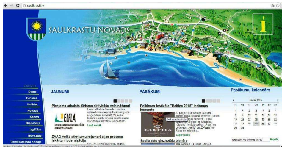
Attēlā: Interneta vietnes www.saulkrasti.lv sākumlapas skats

Lai informētu par jaunumiem un aktualitātēm novadā, tostarp reģionā un valstī, darbojas pašvaldības interneta vietne www.saulkrasti.lv , kurā pieejama informācija par domes darbu, ziņas par notikumiem novada kultūras, izglītības, sporta, tūrisma un citās jomās. Informācija vietnē tiek atjaunota katru dienu, informējot iedzīvotājus par notikumiem, kas ir aktuāli pašvaldībai un tās iedzīvotājiem. Iedzīvotājiem ir iespēja elektroniski mājaslapā nosūtīt jautājumus, uz kuriem tiek sniegtas atbildes.