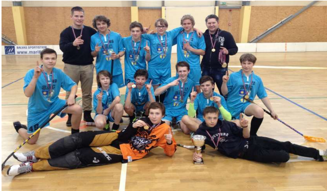
Attēlā: Saulkrastu florbola komanda

svētiku ietvaros noritējušie sporta pasākumi- ielu basketbols, pludmales volejbols, futbols, makšķerēšana, novuss, galda teniss.