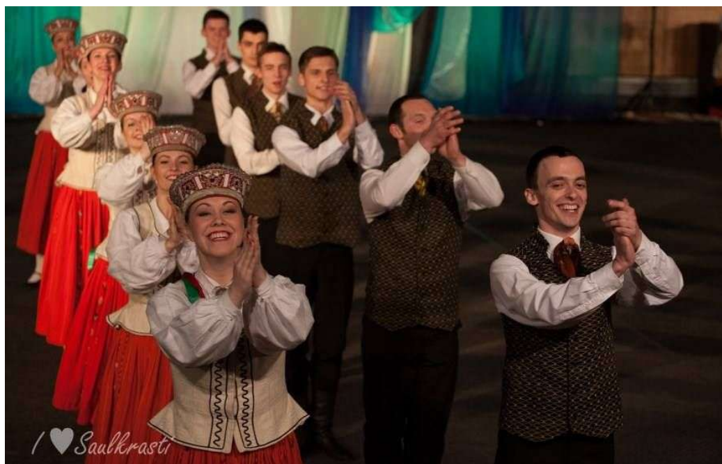
Attēlā: dejojāji tautas deju ansambļu festivālā „Sasala jūrīna”