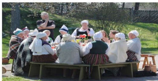
Zvejniekciema „Drimtas” pie baltā klāta galdā iekārta dziesmas un valdīņu priecīgs noskaņojums.

Gatavojoties Latvijas valsts simtgades svētkiem, Latvijas tauta