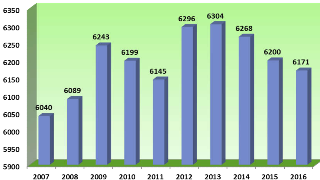
2.attēls Iedzīvotāju skaita izmaiņas Saulkrastu novadā

Iedzīvotāju sadalījums pēc tautības: latvieši – 4879, krievi – 872, baltkrievi – 99, poļi – 59, ukraiņi – 86, lietuvieši – 32, vācieši – 19, ebreji – 11, igauņi – 6, u.c.