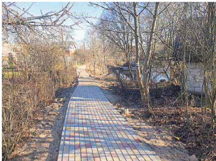
Gājēju ietve gar Aģes upi ved uz jūru, un tā būs arī izgaismota.

2020. notiks dažādas sporta aktivitātes, no tām saulkrastiešu iecienītākās ir: Saulkrastu skrējieni