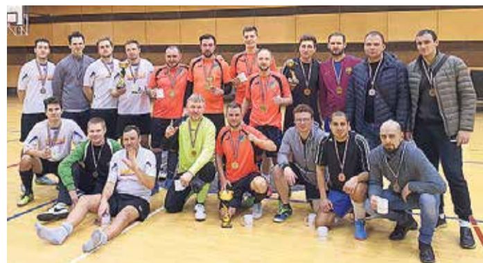
Futbola turnīrā no septiņām Pierīgas novadu komandām uzvarēja Ķīšupes „Dragons”.

Turnīra sākumā tika nolemts spēlēt apļa turnīru ar 12 minūšu laiku vienai spēlei, bez laika apturēšanas, kas turnīru padarīja aizraujošu, jo spēles bija ļoti līdzvērtīgas un visu noteica komandas saliedētība, psiholoģiskā sagatavotība, spēja domāt un ātri īstenot uzbrukumus. Beidzoties apļa izspēlēm, tika aprēķināti punkti, lai izveidotu play-off tabulu. Izspēles notika dienas otrajā daļā, dažās komandās varēja manīt nogurumu, tāpēc bija arī daži negaidīti pārvērsieni.