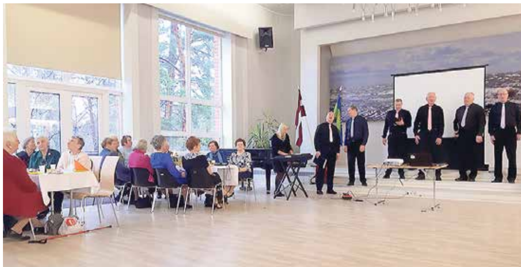
„Atmiņu pēcpusdienā” sirsniņi atzīmēja Saulkrastu Pensionāru biedrības 15 gadu jubileju. Ja vēl kāds seniors apsver, vai katra mēneša pirmo otrdienu pavādit kopā Saulkrastu novada domes telpās, noteikti pievienojieties!