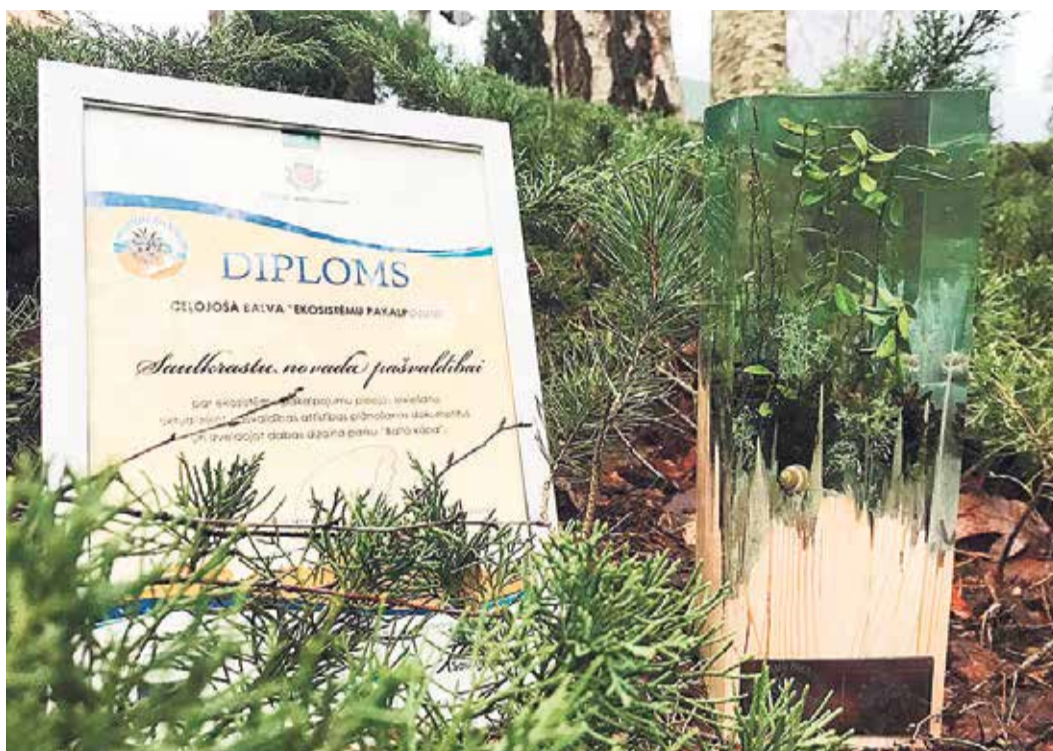
Saņemtā balva „Ekosistēmu pakalpojumi” nozīmē, ka Saulkrastu pašvaldība iet pareizo ceļu vides jomā, izveidojot dabas dizaina parku „Baltā kāpa” un novada plānošanā ieviešot ekosistēmu pakalpojumu pieeju.

tos pieaug apmeklētāju skaits, īpaši Baltajā kāpā. Ne vienmēr apmeklētāji izprot, ka šī teritorija ir īpaša – tai nepieciešama saudzīga attieksme. Pašvaldībai, iesaistoties projektā „LIFE Ekosistēmu pakalpojumi” un izveidojot dabas dizaina parku Baltajā kāpā, ir izdevies pievērst uzmanību šīs teritorijas īpašajām vērtībām, organizēt apmeklētāju plūsmu un veicināt šīs vietas ilgtspējīgu izmantošanu un attīstību. Šajā teritorijā īstenotie risinājumi ir mēģinājums savienot apmeklētāju vēlmi pēc piekļuves unikālai piekrastei un dabas vērtību saglabāšanos. Jāatzīst, ka to paveikt ir liels izaicinājums un tam nepieciešami ikgadēji finansiāli ieguldījumi.