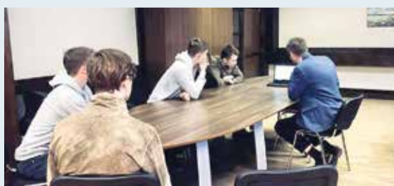
Saulkrastu mežaparkā izbūvēs veloparku jauniešiem

Saulkrasti un Salacgrīva savstarpēji vairāk konkurētu par ieguldījumu apmēru katrā teritorijā. Pēc Finanšu ministrijas datiem, Salacgrīvas novads 2020. gadā saņemts atbalstu no pašvaldību finanšu izlīdzināšanas fonda – 1,5 miljonus eiro.