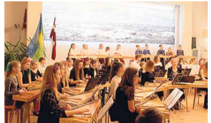
28. februārī Saulkrastos tradicionāli koncertēs koklētāji.