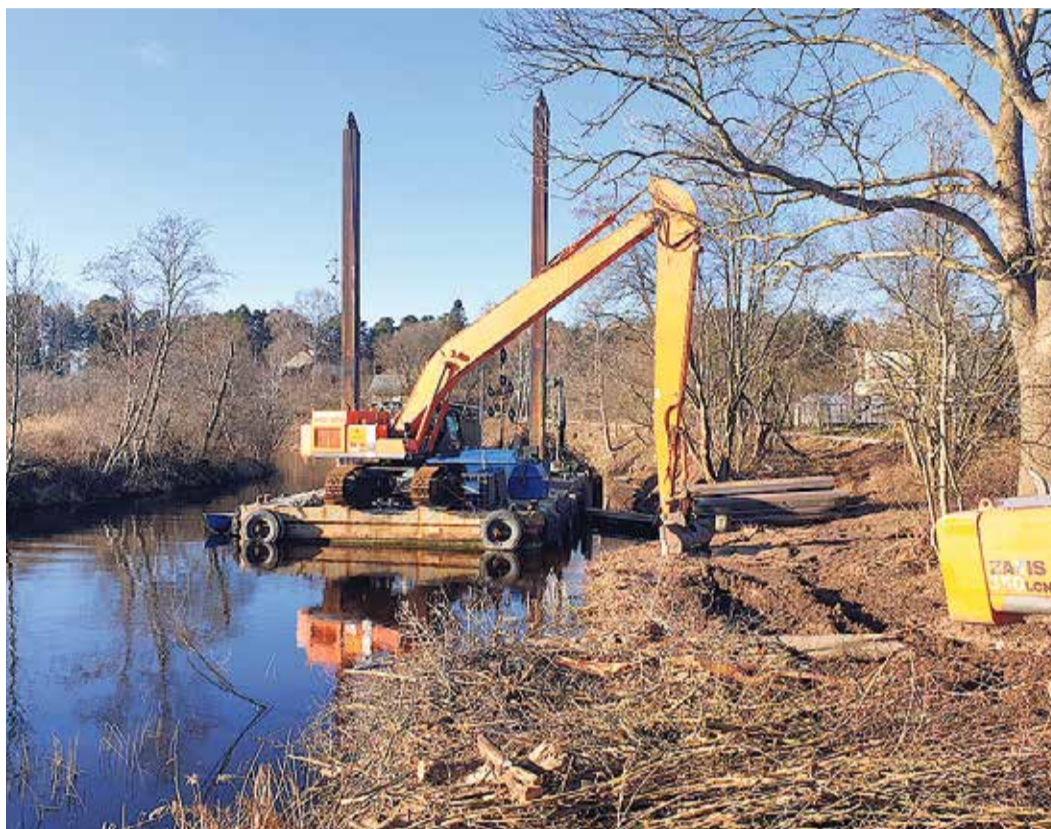
Notiek Aģes upes krasta stiprināšana un apkārtnes labiekārtošana, bet jau 1. augustā visi būs laipni gaidīti uz pirmajiem Ostas svētkiem Zvejnieciemā.

Pabeidzot jaunā celiņa izbūvi un upes krasta attīrīšanu no kritušajiem kokiem un krūmiem, atklāsies ainavisks skats uz Aģes upi un ostas teritoriju.