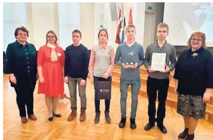
Zvejniekciema vidusskolas jaunie matemātiķi matemātikas konkursā Liepājas Universitātes Dabas un sociālo zinātņu fakultātes profesora Edvina Ģingūļa piemiņai.

Šis matemātikas konkurss Liepājas Universitātē tiek rīkots kopš 2005. gada, un tā galvenais mērķis ir veicināt jaunatnes interesi par matemātiku. No Zvejniekciema vidusskolas tajā piedalījās divas komandas – katrā četri dalībnieki. Algebras un ģeometrijas uzdevumu saturs konkursā atbilst izglītības standartam, un tam nav nepieciešamas papildu zināšanas, turklāt panākumus nosaka uzdevumu risināšanas ātrums un sadarbība starp komandas locekļiem. Konkurss notika 2 kārtās: