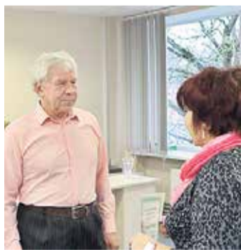
Datormācību kursu vecākajai paaudzei dalībnieki saņēma bibliotēkas apliecinājumus par prasmju iegūšanu.

Mācības notika pēc projekta „Pieslēdzies, Latvija!” bezmaksas datormācību materiāliem, kuros ietverti arī praktiskie vingrinājumi zināšanu nostiprināšanai. Noslēguma pasākumā kursu da-