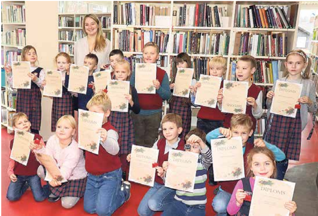
Lūk, Saulkrastu vidusskolas 2.b klases skolēni projektā „Bērnu, jauniešu un vecāku žūrija”.

Ilze Dzintare, Saulkrastu novada bibliotēkas vadītāja