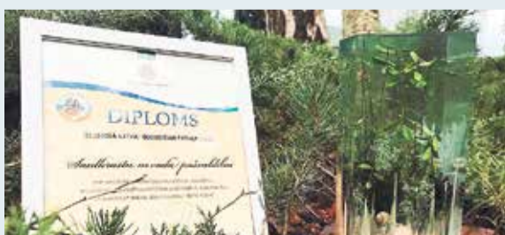
Saņemta ceļojošā balva „Ekosistēmu pakalpojumi”