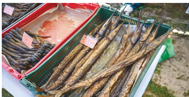
Kūpinātā produkcija ātri nonāca pircēju rokās