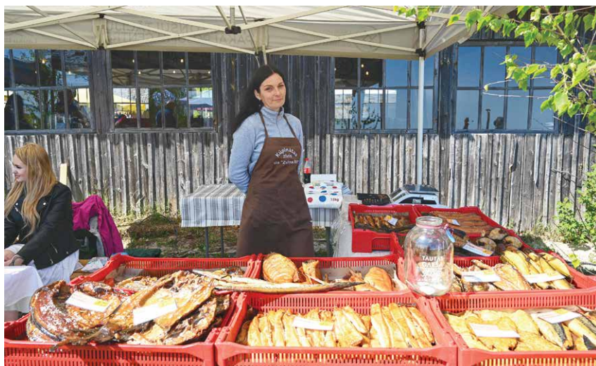
“Tautas garša” balsojumā arī uzņēmums “Zviņa RR” izpelnījās apmeklētāju atzinību, piedāvājot plašu produkcijas klāstu