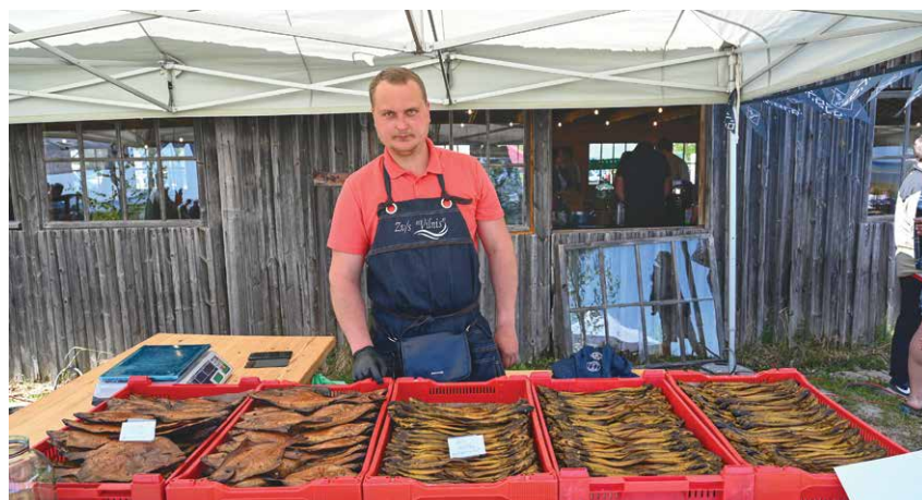
“Tautas garšas” balsojumā zv/s “Vilnis” ieņēma godpilno 2. vietu