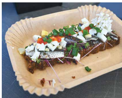
Meistarklase “Pagatavo savu ķilavmaizi pats!” izpelnījās lielu apmeklētāju interesi. Ar “Klapkalnciema zivis” dotajām ķilavām tapa padsmīt dažādu ķilavmaizņu versijas