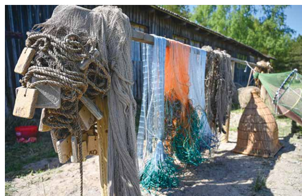
Apmeklētāji varēja iepazīt arī dažādus piekrastes zvejnieku lietotos zivju ķeršanas rīkus