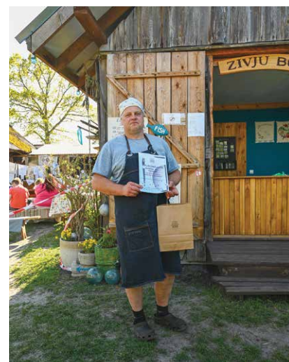
“Tautas garša” balsojumā zvejnieku sēta “Dienīnas” ieņēma godpilno 2. vietu