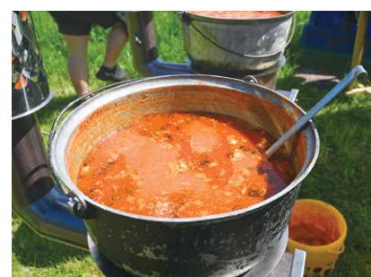
Visi, kas nobaudīja, slavēja garšo zivju soļanku