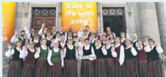
Koris „Bangotne” viesojas Īrijā