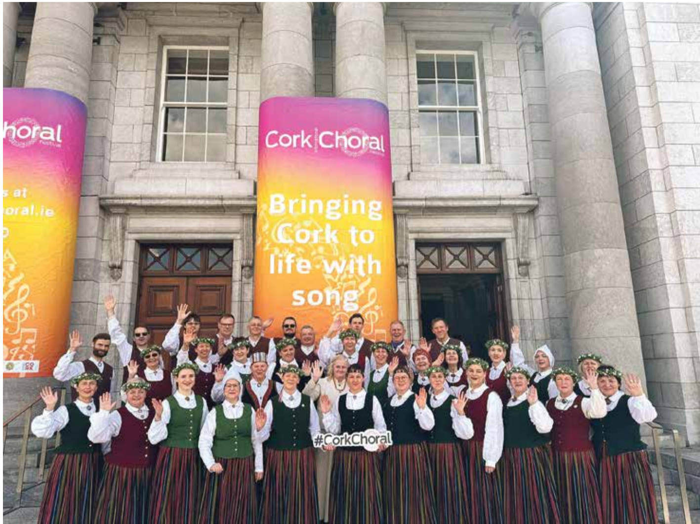
Pie Sv. Finbara katedrāles.