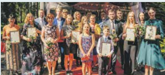
Pašvaldība godina labākos skolēnus un pedagogus 6. lpp.