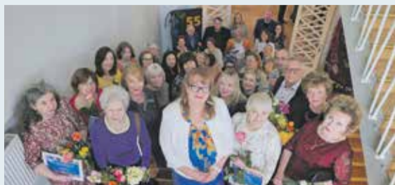
Vidzemes jūrmalas Mūzikas un mākslas skola svin jubileju 4. lpp.