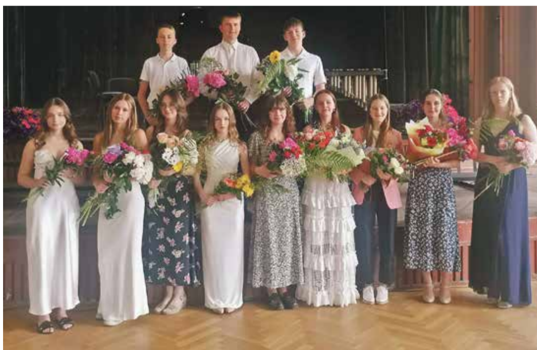
2024. gada VJMMS Mūzikas klases izlaiduma absolventi.