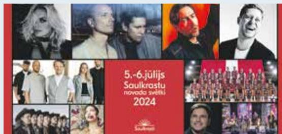
Saulkrastu novada svētki 8. lpp.